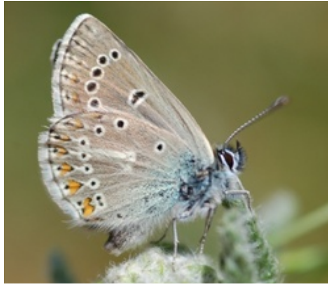
Argus de la sanguinaire Eumedonia eumedon