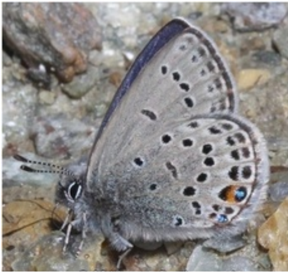
Azuré de la Canneberge Agridades optilete

33 espèces au total, dont 3 espèces rares au Val d'Anniviers :