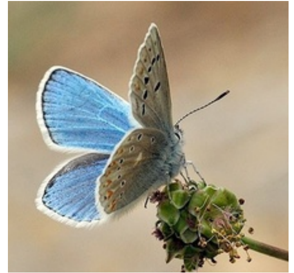
Azuré du mélilot Polyommatus dorylas